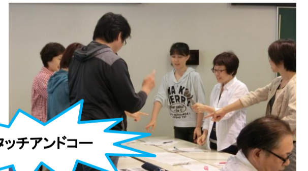
タッチアンドゴー